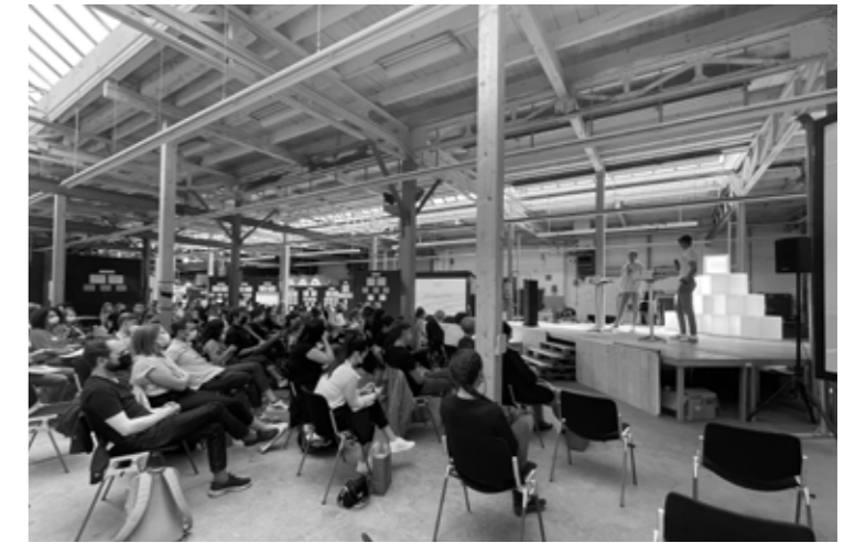
Grand hall (Event Campus Democratie)