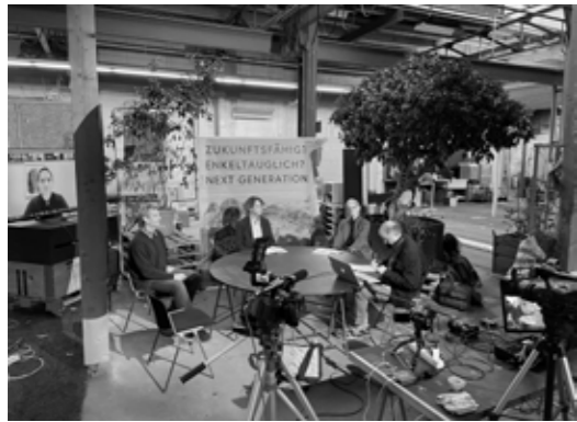
Dispo On Air (Studio, Hybridevents)