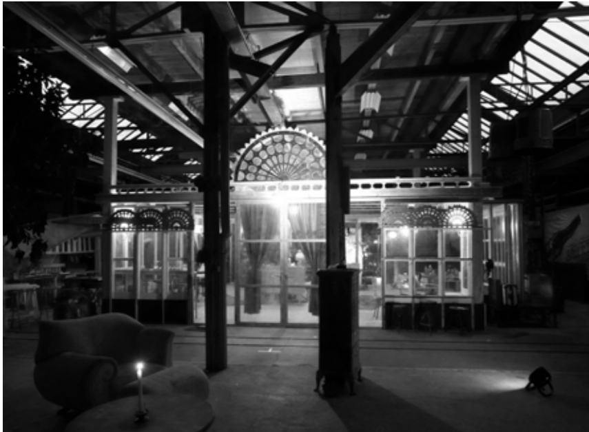
Crystal Palace (Espace pour 1-50 Persones)