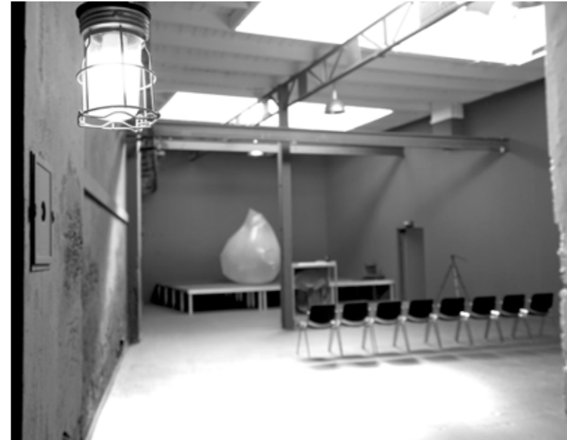
Black Room (Place 1-200 Persones)