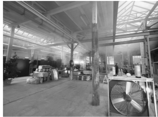
Grand hall (Place pour 1-600 personnes, Filmset GVB)